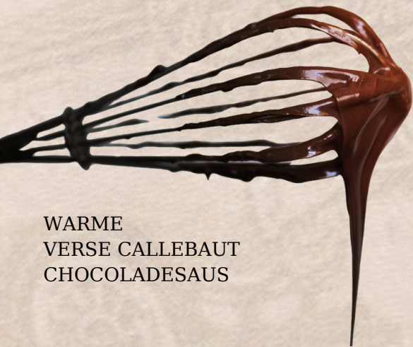
WARME VERSE CALLEBAUT CHOCOLADESAUS